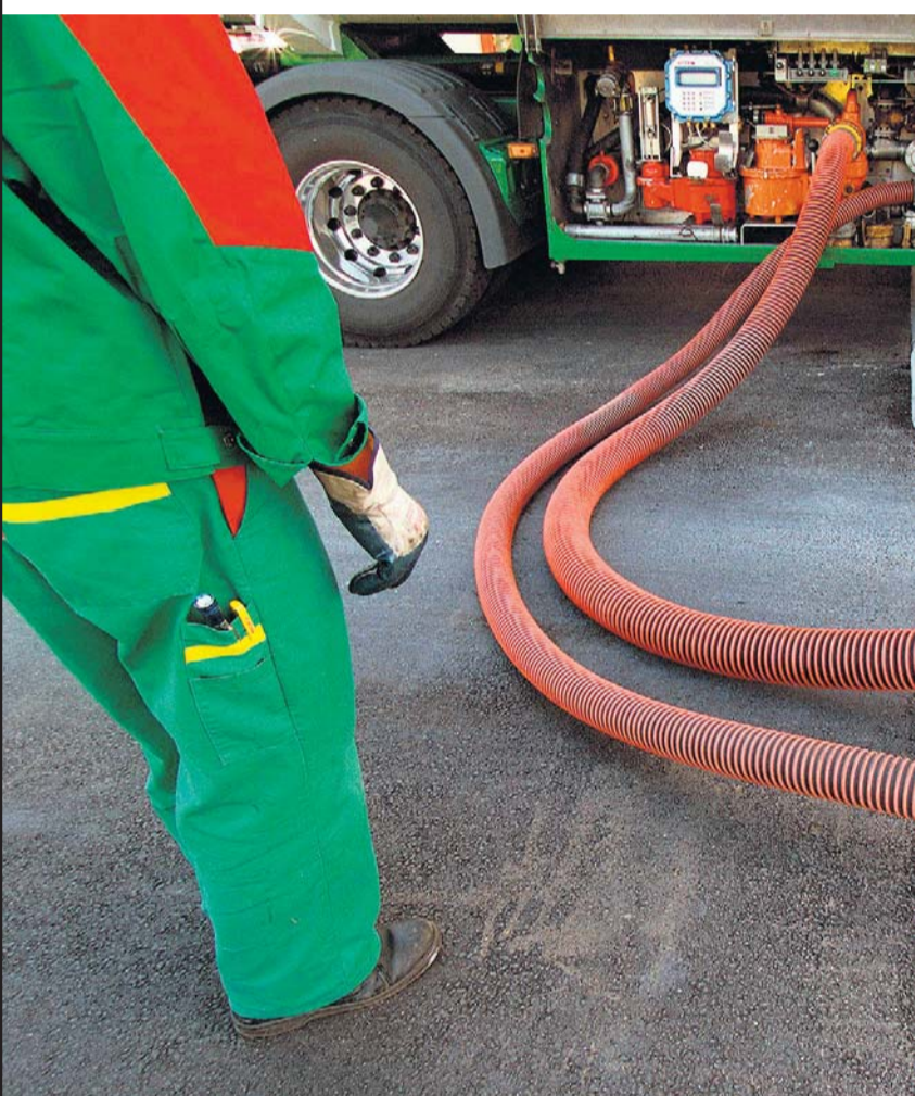
Das Spekulieren auf den günstigsten Zeitpunkt für den Heizölkauf lohnt sich selten.

ENERGIEPREIS Es ist höchste Zeit, Heizöl zu bestellen. Hausbesitzer können es über das Pooling gemeinsam einkaufen.